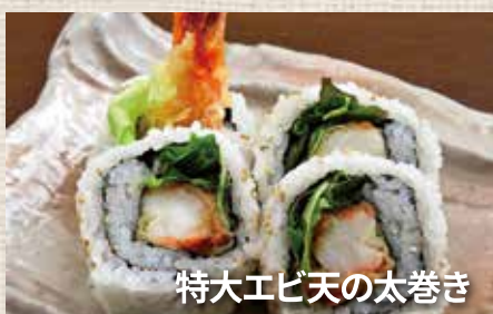
特大エビ天の太巻き