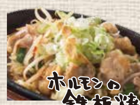
ホルモンの 鉄板焼