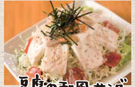
豆腐の和風サラダ