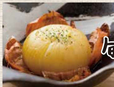
旬 たまねぎ の丸焼き