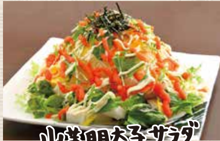
山芋明太子サラダ