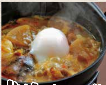
牛すじのとろとろ煮