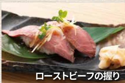
ローストビーフの握り