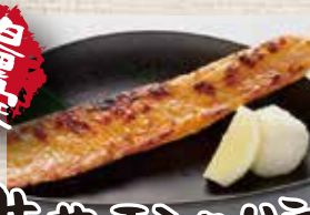
生サーモンのハラス焼き