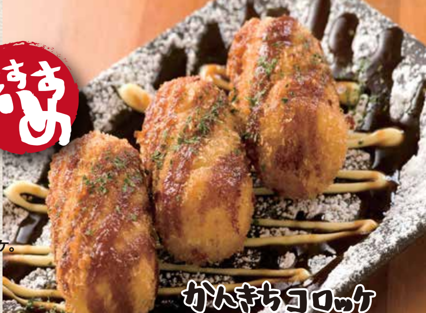
かんきちコロッケ