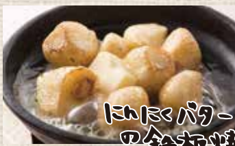
にんにくバター の鉄板焼