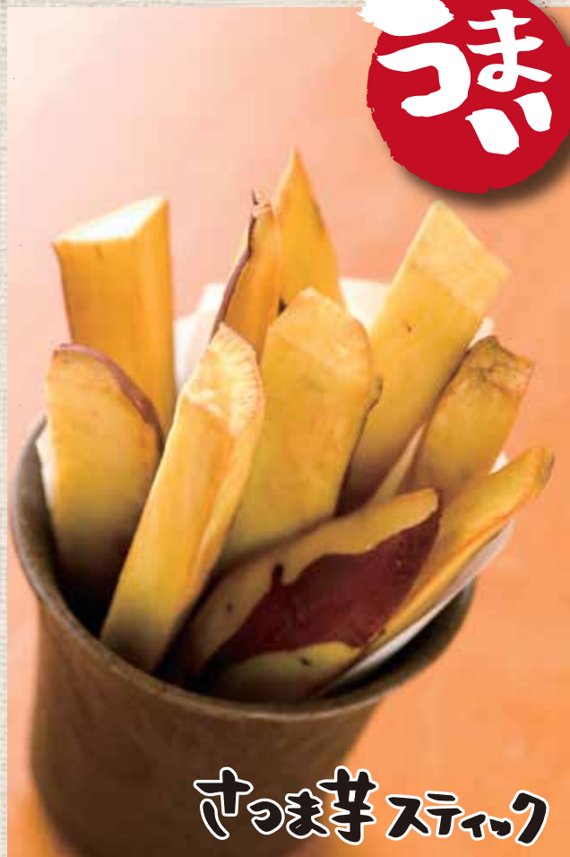
さつま芋スティック