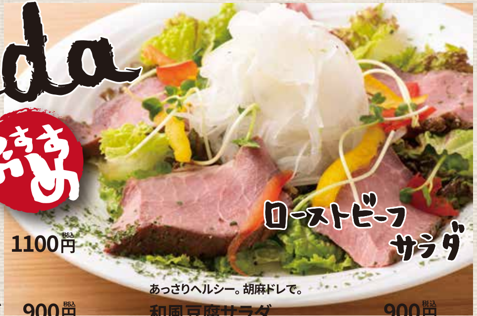
ローストビーフ サラダ