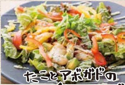
たことアボガドの 彩りサラダ